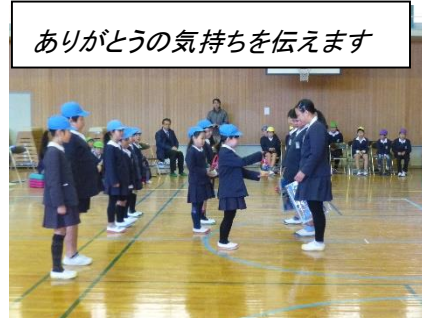
ありがとうの気持ちを伝えます