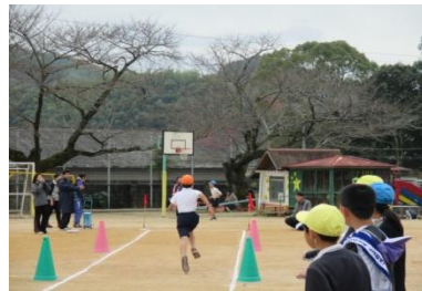
かっこいいでしょ! 6年生のたくましい走りです