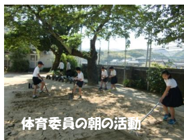
体育委員の朝の活動

り方やヘルメット着用が自分の命を守ること、安全な乗り方等を出口駐在さんに指導してもらいました。ポイント指導いただいたPTA補導委員の皆様ありがとうございました。また普段から、地域の方々も子ども達の安全を見守って下さっています。学んだことを毎日の登下校や放課後の交通安全に生かして、事故に遭わないようにすることが、お世話になっている事へのお礼になります。*7月には全学年が自転車教室をします。