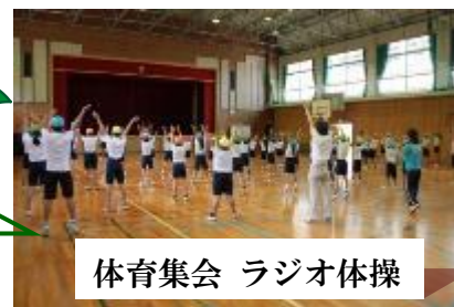
体育集会 ラジオ体操

ほたる祭り当日の13日をさけて平日出かけましたが、それでもたくさんの人と車。辺りが暗くなり始めると梅雨の合間の幻想的な風景が浮かび上がり、灯籠に誘われるように遊歩道を歩きました。この灯りをつないでいきましょう。・・・ 希望 勇気 挑戦